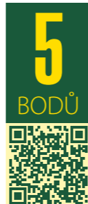
Batož BOLL Ranger