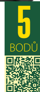
Bruska na nože Graef CX 110